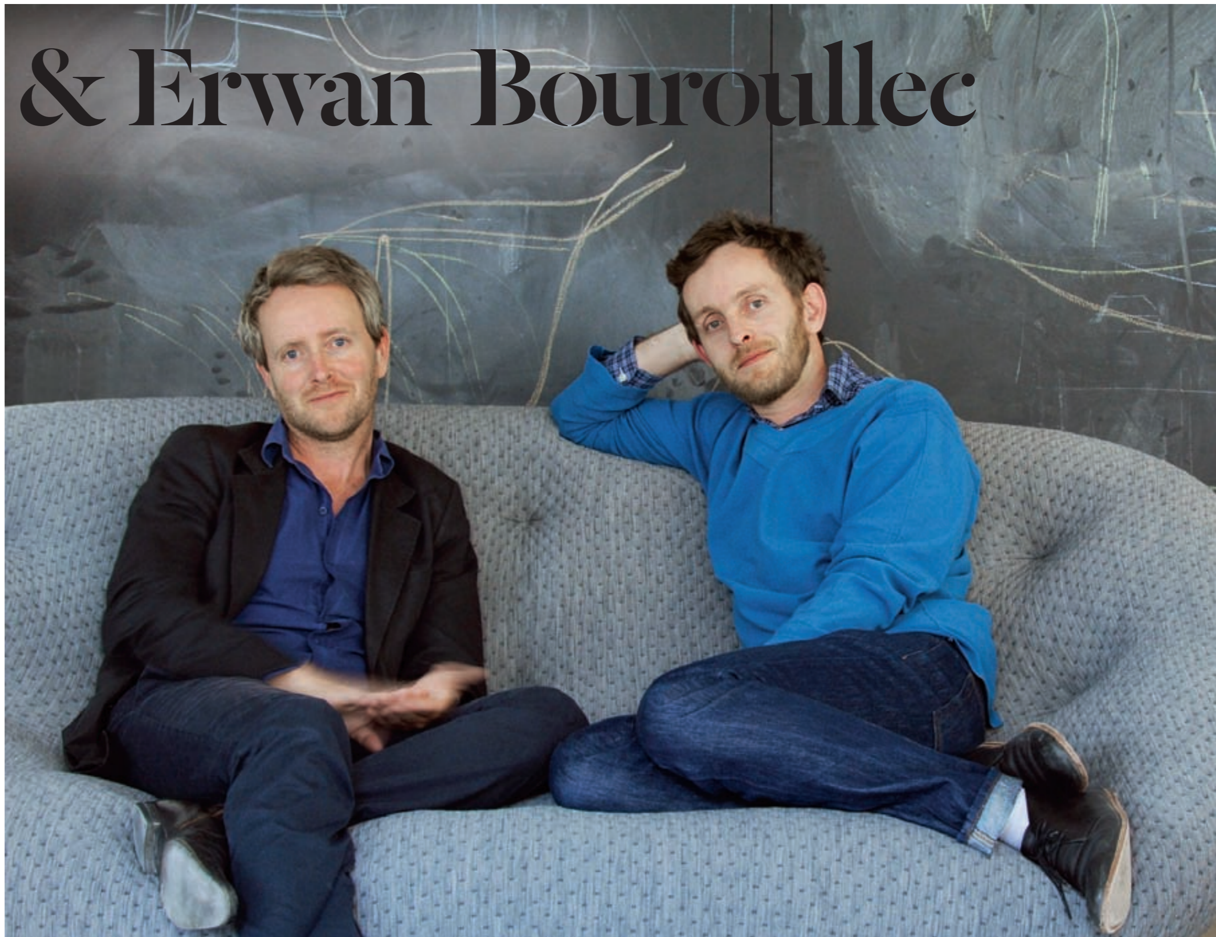
Ronan & Erwan Bouroullec on their latest creation for Ligne Roset: the Ploum sofa.

ブルムはその独自のシェイプによって、とても魅力的で、どんなポジションでもリラックスできる優れた快適さを提供します。