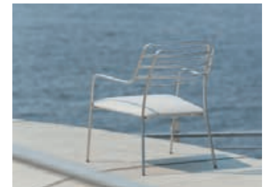
Main picture: Seram table, Aluchair chairs, Maternity and Clover Pot flower pots. Top and right: Résilie chairs. Left: Grillage armchair.